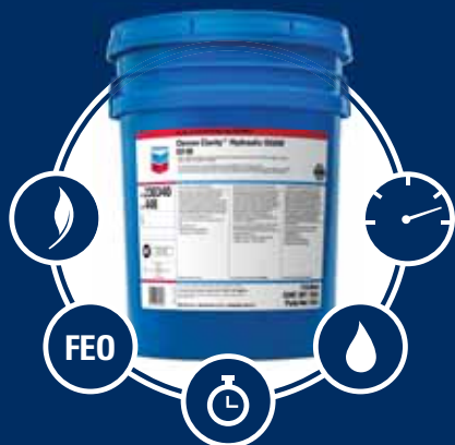
Huile hydraulique synthétique Clarity® AW

Chevron a conçu une gamme complète de fluides hydrauliques de haute qualité pour mieux répondre aux besoins de votre entreprise. Chacun est formulé avec précision pour vous aider à maximiser les performances et les économies.