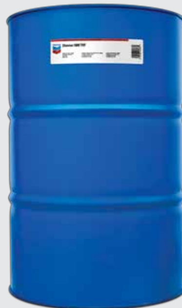
Chevron 1000 THF